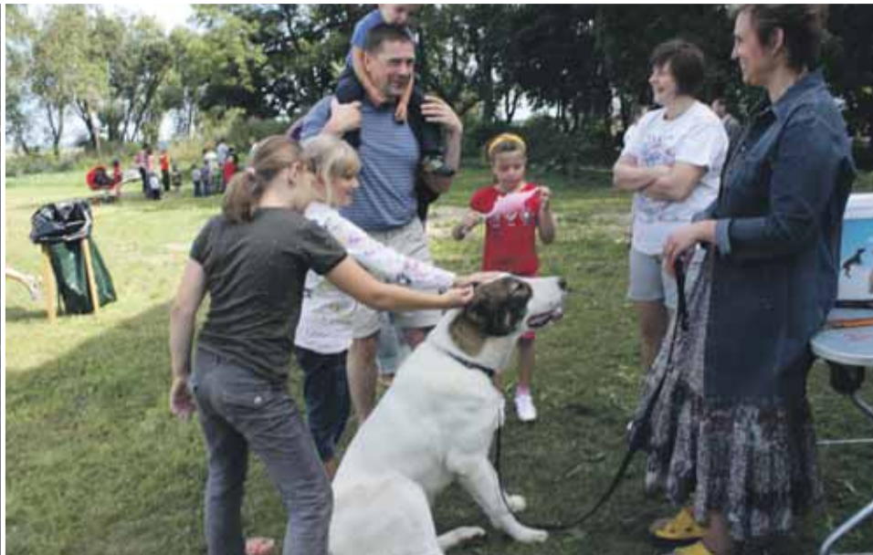
Kesk-Aasia lambakoer Bei kennelist Ribessita.