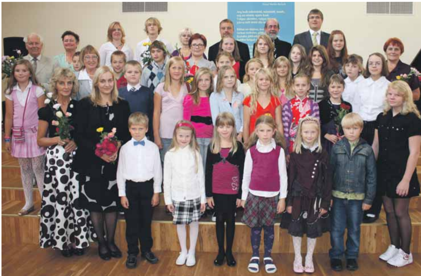
Jõelähtme Muusika- ja Kunstikooli esimene aktus.

Laiendama on hakatud Neeme ja Loo lasteaedu. Neeme lasteaia peaks juba septembris avatama üks uus rühm ja saal. Loo lasteaia saab jaanuaris lausa nelja rühma jagu lapsi uutesse ruumidesse ja saali. Endiselt ootame vastust vabariigi