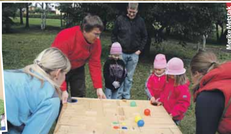
Loo lõbus perepäev.