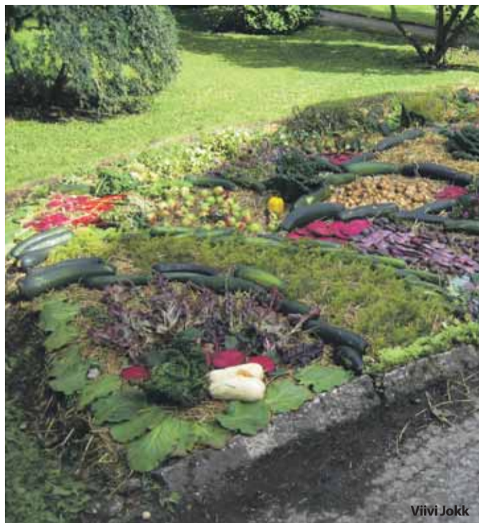
Eesti esimene innovaativne peenar tehti Kostiveres.